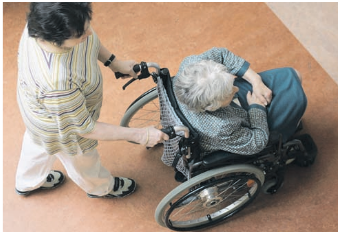
Teure Pflege. Bewohner von Baselbieter Pflegeheimen werden massiv zur Kasse gebeten.

Eine neue Studie stützt die Kritik der Grauen Panther